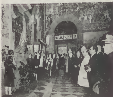
Estação de S. Bento: Comemoração histórica